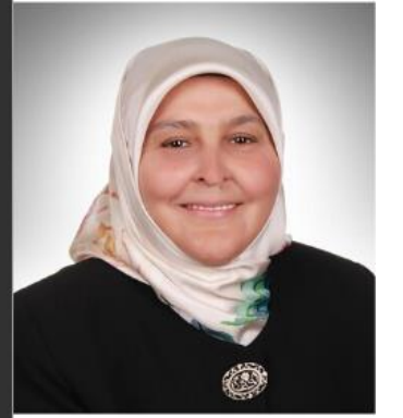
Habibe ÖÇAL Kahramanmaraş Milletvekili